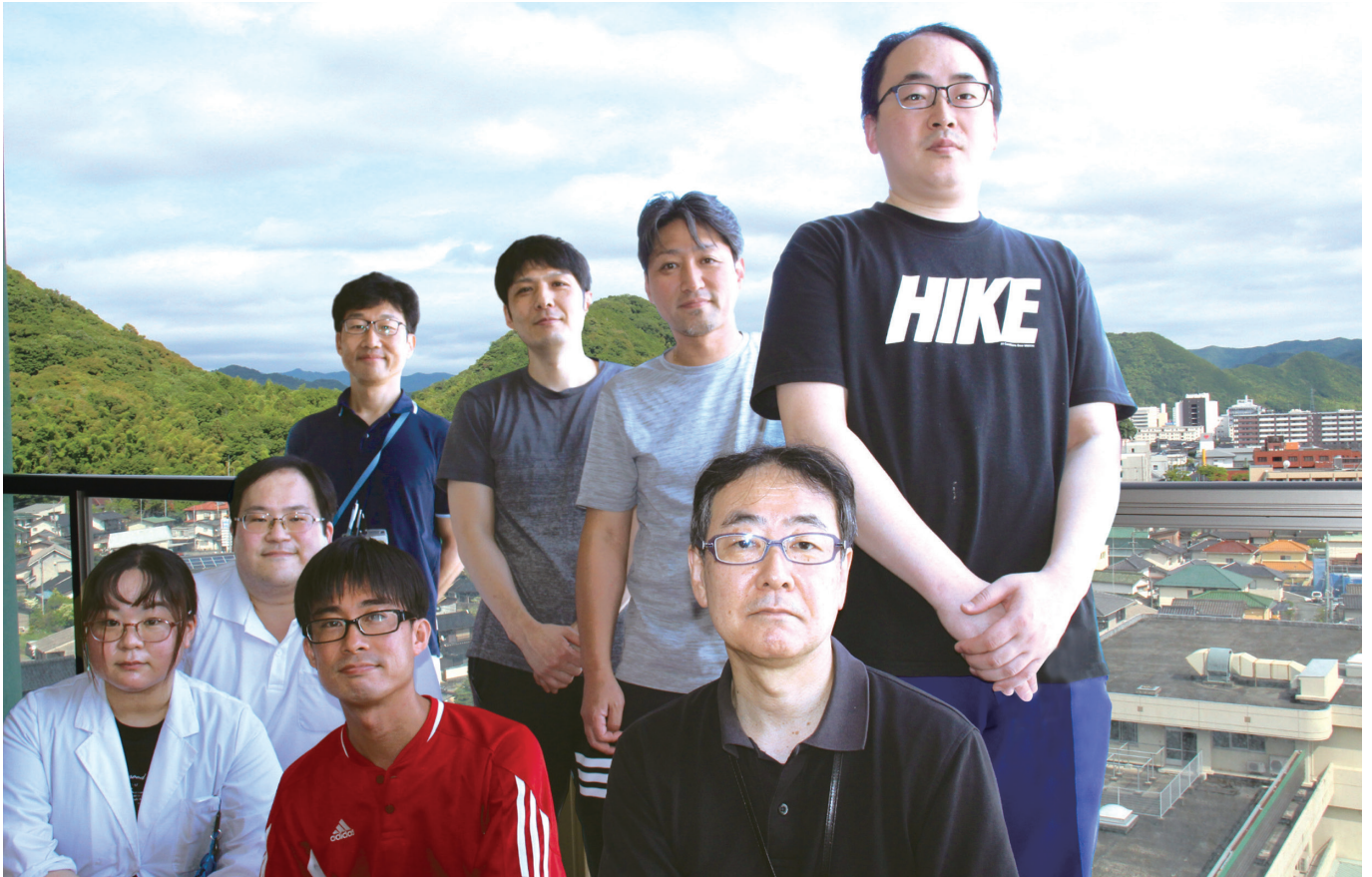
安らかな最期を迎えることができるよう、私たちがサポートします。 詳しくは2ページへ

当センターは、湯田温泉の独自の泉源を保有し、温泉プールでのリハビリ、足湯サービス、各施設での入浴に活用しています。本紙は、熱意を持ったきらめきスタッフが、温泉のように“ほっと”する和やかな話題をお届けします。