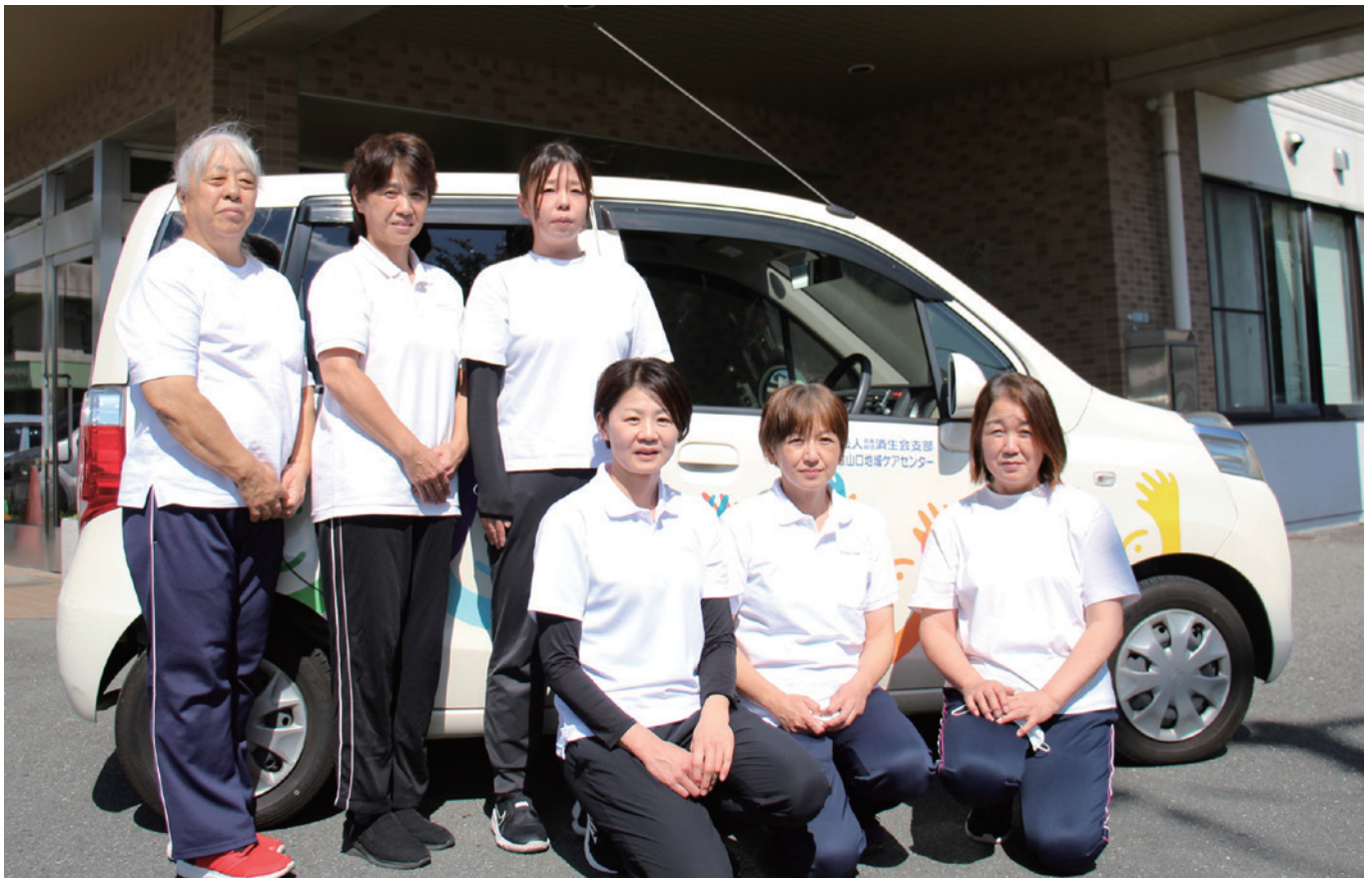
地域でのくらしをサポートするホームヘルパー。 詳しくは2ページへ

当センターは、湯田温泉の独自の泉源を保有し、温泉プールでのリハビリ、足湯サービス、各施設での入浴に活用しています。本紙は、熱意を持ったきらめきスタッフが、温泉のように“ほっと”する和やかな話題をお届けします。