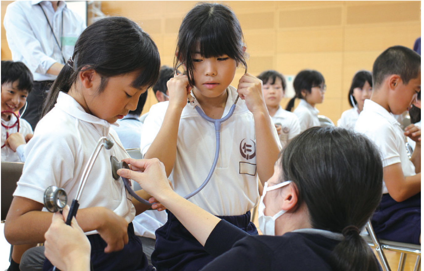
地域と共に、にほ 苑の取組 詳しくは2ページへ

当センターは、湯田温泉の独自の泉源を保有し、温泉プールでのリハビリ、足湯サービス、各施設での入浴に活用しています。 本紙は、熱意を持ったきらめきスタッフが、温泉のように“ほっと”する和やかな話題をお届けします。